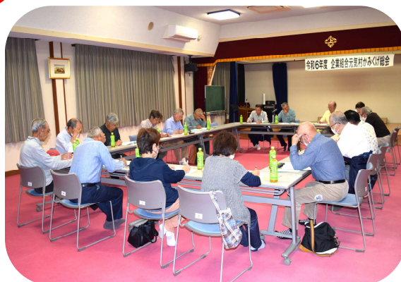
対座形式により議論活発化

草刈り範囲の一部を外部委託する。 ☆食堂内恐竜グッズコーナーの改善など、可能などから実施していく。 ◆質疑応答では、インボイス制度への対応や利益準備金積立の件、食堂に独自の名物メニューが必要ではないかなど、活発な議論がありました。地域の方々にも積極的に来店してもらい、改善点を提案して頂きたいと思っています。