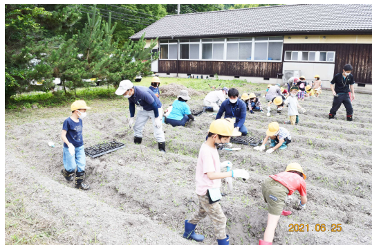
慣れない手つきで苗植えに初挑戦

6月25日に上久下小学校1・2年生16人が、青田の田んぼで黒豆の苗植えに挑戦しました。10日前ポットに種まきをして育てた苗300本を、元気村かみくげ野菜部会のメンバーとJA職員らに指導してもらいながら真剣に植えていきました。終了後の挨拶では「教えてもらったから上手に植えることができました」と、お礼の言葉を発表していました。これからの世話が大変だと思いますが、秋にはおいしい黒枝豆が食べられるでしょう。