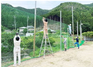
新しいネットの取付け