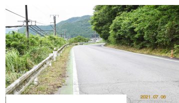
篠場・畑内間の市道