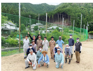
3日目 完成時の記念写真