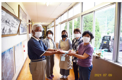
野垣会長から金曜日の当番 4 人に贈呈

コロナ禍のなか、上久下小学校の消毒・清掃を一年前から続けておられるボランティアの方々に対して、上久下地域自治協議会が 7 月 9 日に感謝の記念品を贈呈しました。児童たちが帰った後、毎日 4 人づつが当番になり校内の感染対策のお手伝いをしてもらっているお陰で、安心して学校生活が送れていると思います。