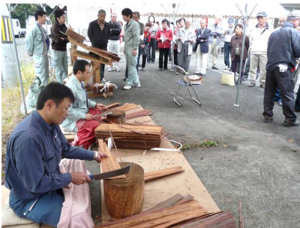
檜皮ふきを実演中